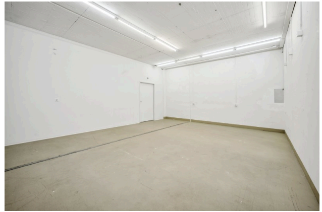
Gewerberaum / Archiv