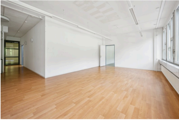
Büro 2 / Sitzungszimmer