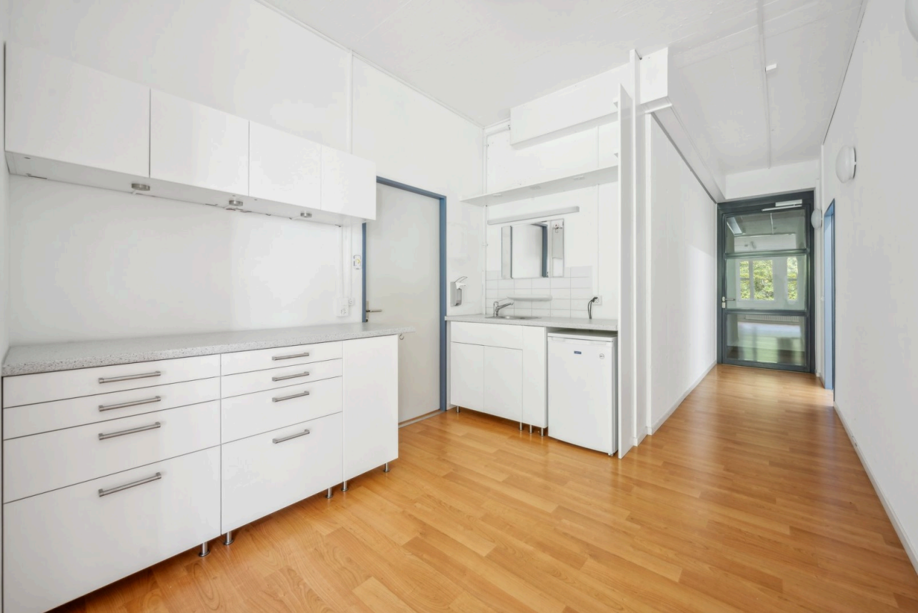
Bistrobereich, Korridor, Eingang