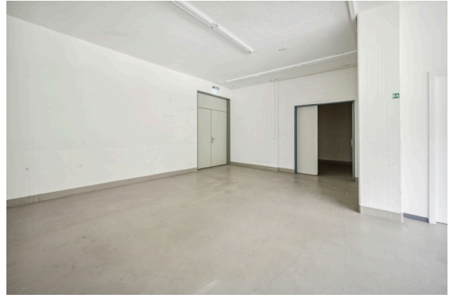
Gewerbebereich mit Zugang zum Warenlift