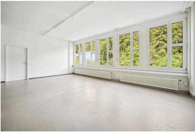
Gewerbebereich mit Hartbetonboden (grau gestrichen)