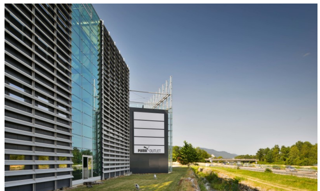
Aussenansicht Richtung Zürich