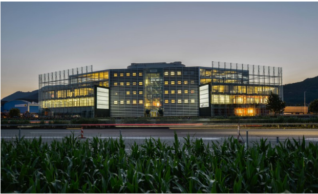
Frontansicht mit Werbemöglichkeiten