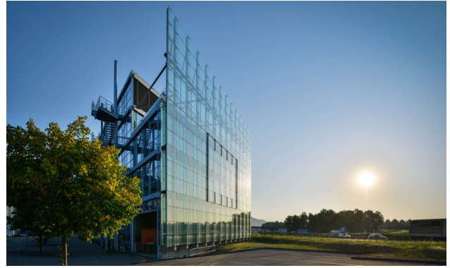
Spiegeln im Glas