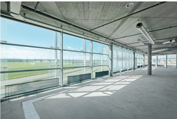
Blick Richtung Süden