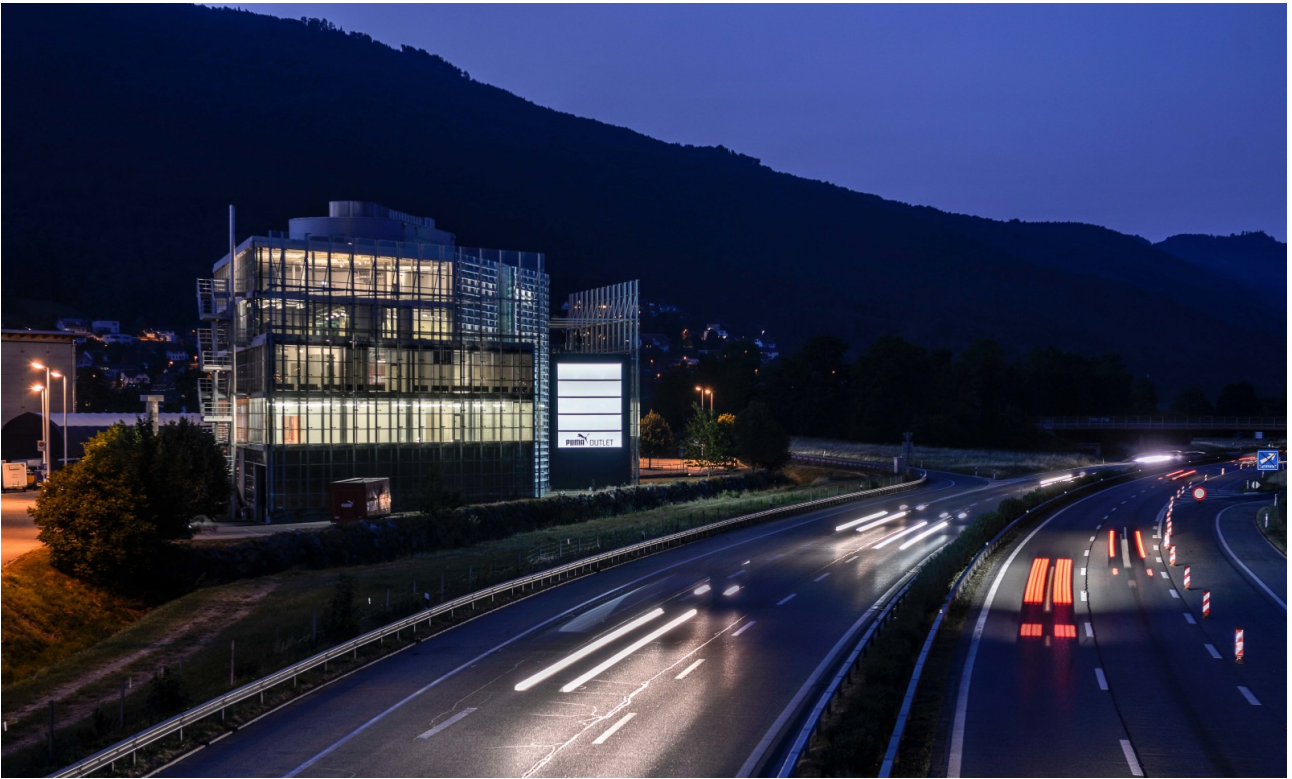
Beleuchtete Werbeträger - gute Sichtbarkeit