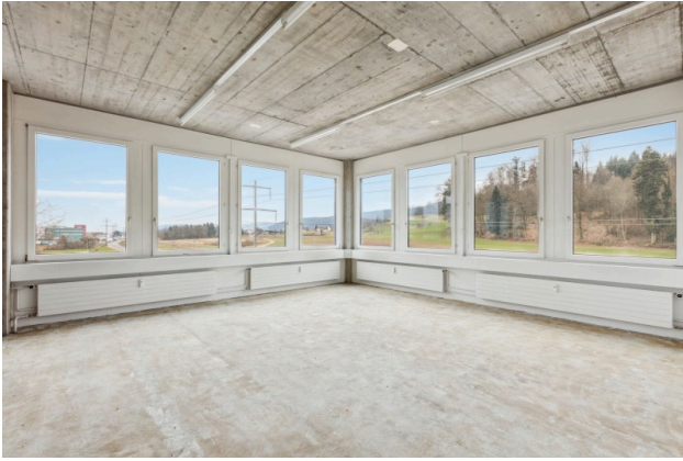
Halboffenes Eckbüro mit Blick ins Grüne