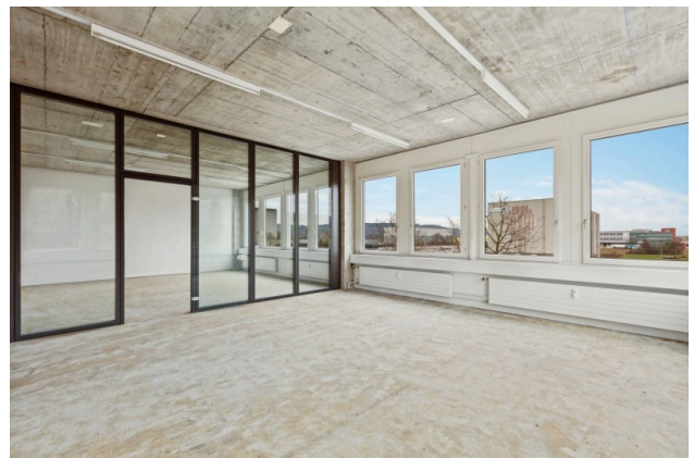
Offener Bürobereich / Sitzungszimmer