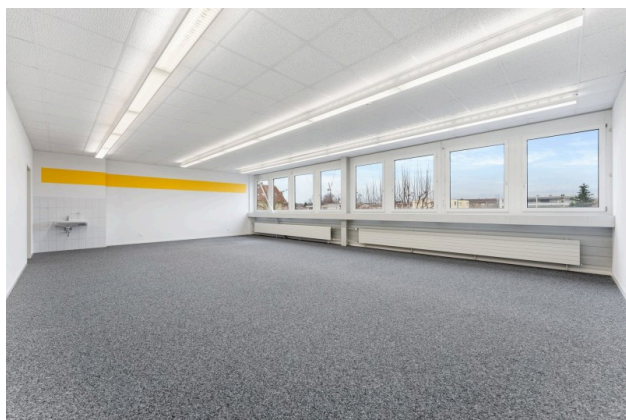
Büro mit Lavabo