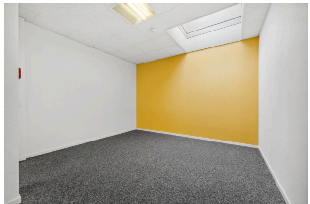
Büroraum mit Oblicht