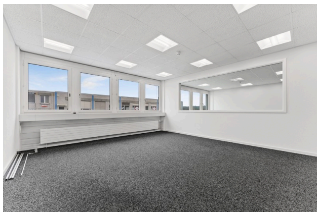
Bürofläche mit Glaseinsatz