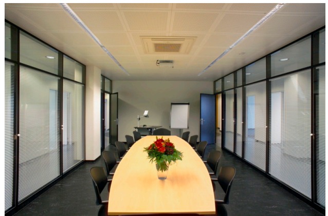
Sitzungszimmer, klimatisiert und möbliert