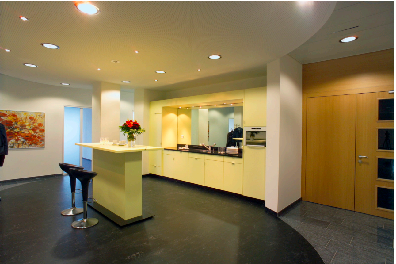
Entrée mit Teeküche/Aufenthalt