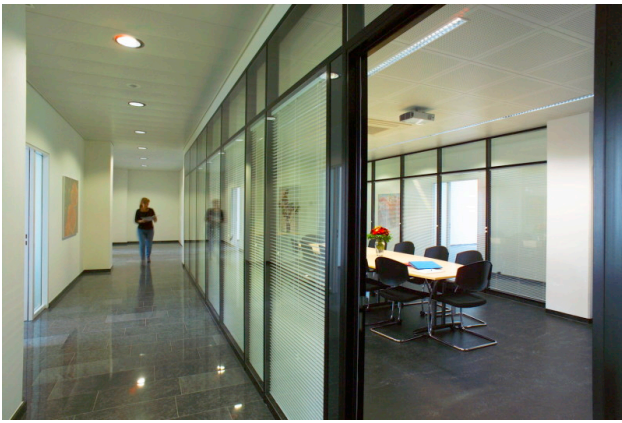
Korridor zu Büros/Sitzungszimmer