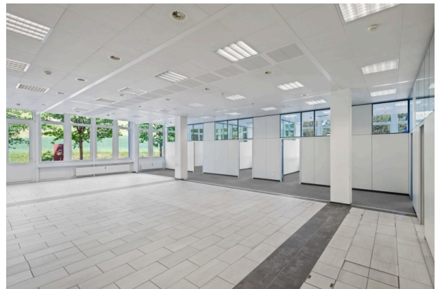
Offener Bürobereich mit Blick ins Grüne (Visualisierung Teppichboden)