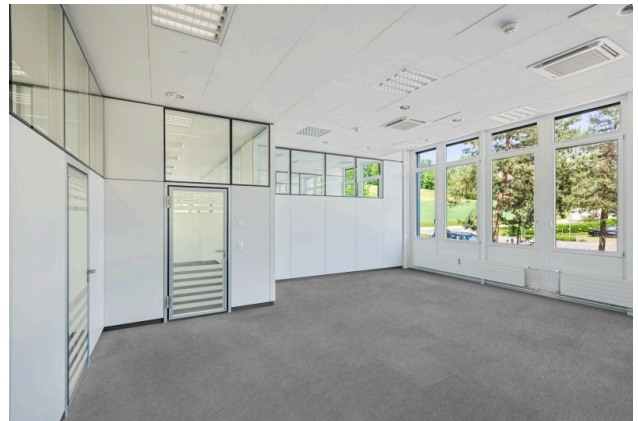
Büro mit Zugang Anlieferung (Visualisierung Teppichboden)