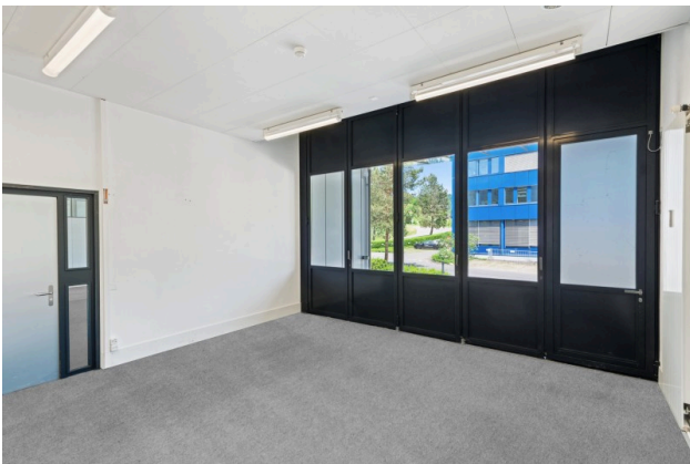
Eingang Anlieferung / Lager (Visualisierung Teppichboden)