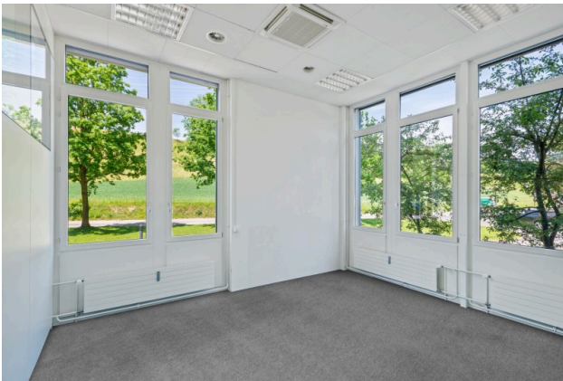
Lichtdurchflutetes Einzelbüro (Visualisierung Teppichboden)