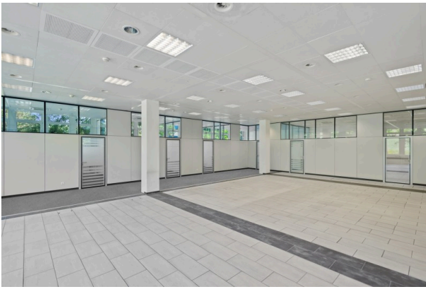
Ansicht auf Büro- respektive Sitzungszimmer (Visualisierung Teppichboden)