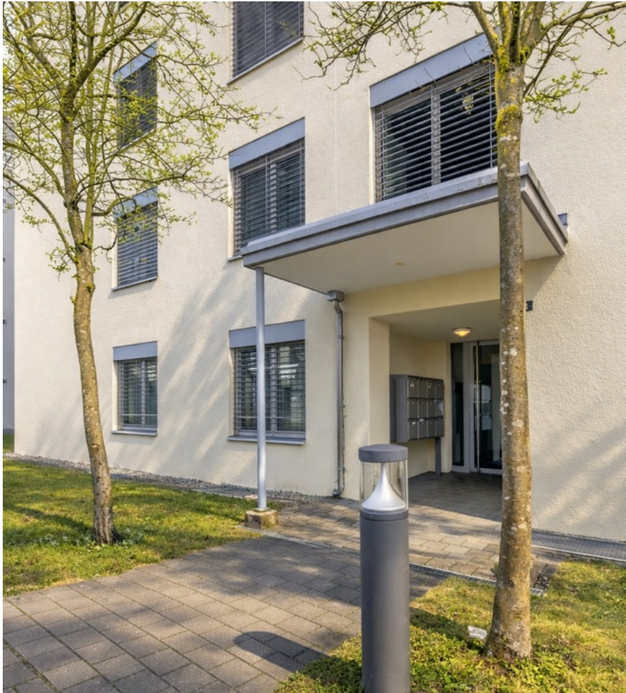
Erdgeschoss | Eingang