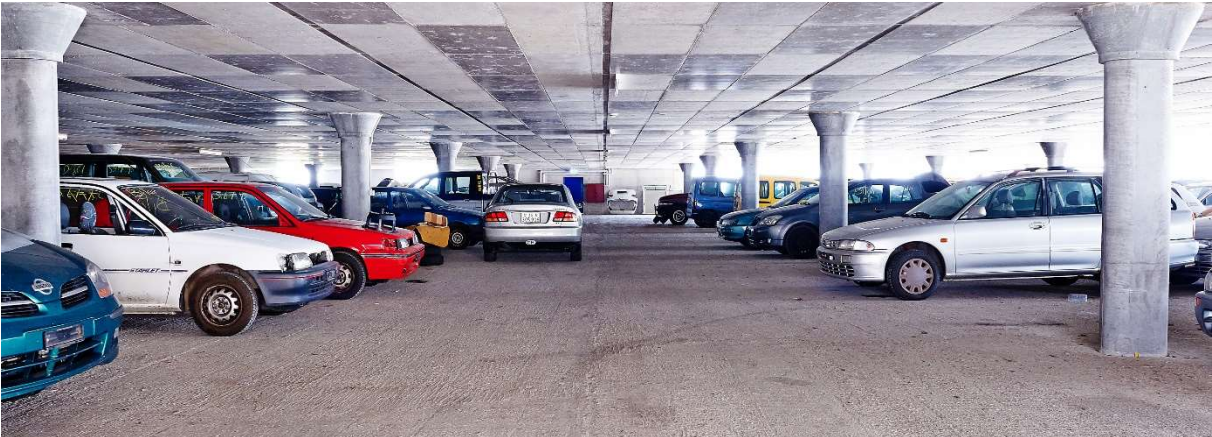
Ansicht Zufahrten von Buchenhagstrasse