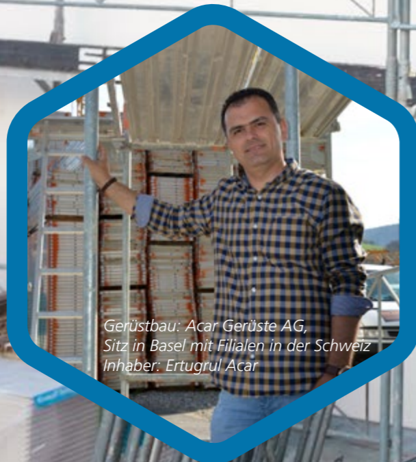
Gerüstbau: Acar Gerüste AG, Sitz in Basel mit Filialen in der Schweiz Inhaber: Ertugrul Acar