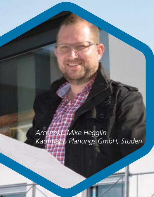
Architekt: Mike Hegglin Kaufmann Planungs GmbH, Studen